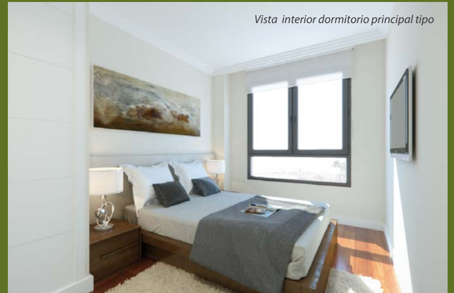
Vista interior dormitorio principal tipo