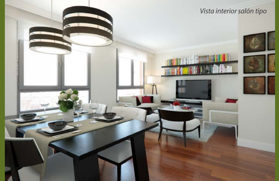
Vista interior salón tipo